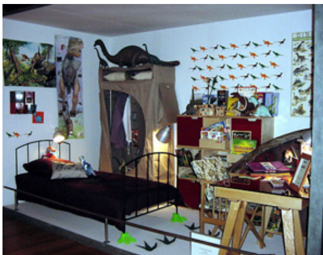
Fig.6.-Recreación del dormitorio de un niño/a dinomaniaco. Exposición "Mitología de los dinosaurios".

La dinomanía es el fenómeno sociocultural que aglutina la estructura de mito dinosauriano y la convierte en una manifestación real de los deseos y ensoñaciones de parte de la sociedad humana. Básicamente se trata de un "apetito desordenado" de acaparar información sobre los dinosaurios: su forma de vida, apariencia, tamaño, etc. La dinomanía es un fenómeno parecido al que surge sobre las estrellas del cine, el deporte o la televisión, y genera un deseo de proximidad que cristaliza en acaparar imágenes y otras representaciones gráficas de los dinosaurios (Fig.6).