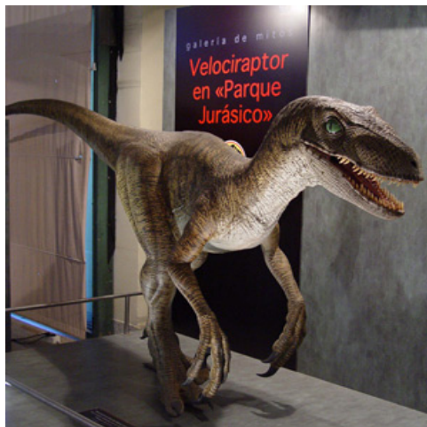
Fig.2.- El terópodo Velociraptor tal y como aparece en la película "Parque jurásico" ("Jurassic Park") dirigida por Steven Spielberg en 1993. El dinosaurio está conscientemente aumentado de tamaño en la película. Hoy día sabemos que este dinosaurio, como cercano pariente de las aves, estaba cubierto de plumas. Escultura de Javier Hernández para la exposición "Mitología de los dinosaurios".