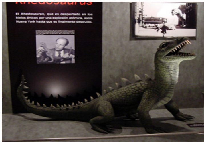
Fig.4.- Recreación del dinosaurio de la película "El monstruo de tiempos remotos" ("The Beast from 20.000 Fathoms", 1953), un típico ejemplo del conflicto entre la civilización humana y los dinosaurios (la naturaleza) en el discurso fantástico. Escultura de Javier Hernández para la exposición "Mitología de los dinosaurios".