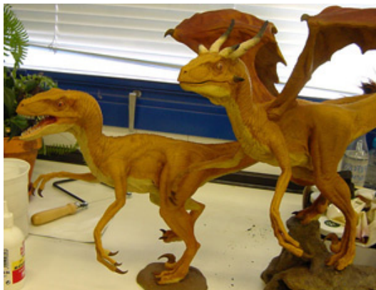
Fig.5.- Comparación entre un dinosaurio y un dragón. Se puede conseguir una representación del segundo simplemente añadiendo algunos elementos característicos al primero (por ejemplo, cuernos y alas). Maquetas realizadas por el artista soriano Javier Pérez Valdenebro para la exposición "Mitología de los dinosaurios".

hallazgo de restos de plesiosaurios. Los dinosaurios están también presentes como personajes sustitutivos de los dragones en la iconografía de "la bella y la bestia".